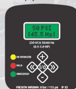
Display del variador

La bomba y controlador están interconectados hidráulica y eléctricamente, e incluyen 1.5 m de cable por cada bomba para conexión a red eléctrica.