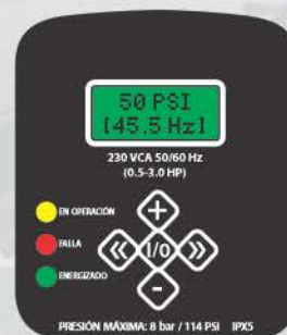
Display del variador